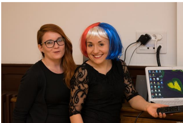
Cheveux „bleu blanc rouge“