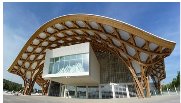
Centre Pompidou Metz

Der letzte Tag beinhaltete eine Besichtigung des Centre Pompidou Metz , in dem uns die moderne Architektur sowie abstrakte Kunst näher gebracht wurde.