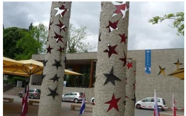
Schengen : les colonnes étoilées

Es war am Donnerstagmorgen, wir sind nach Schengen mit dem Bus gefahren. Zuerst hatten wir Zeit, um die Sehenswürdigkeit zu entdecken. Dann haben wir eine Rallye gemacht, durch die wir viele Informationen über den Schengener Raum gesammelt haben. Wir konnten ins Museum gehen oder draußen bleiben. Um die Antworten zu finden, hatten wir deutsch-französische Gruppen gebildet. Wir sollten auch ein originelles Foto aufnehmen, damit wir Europa vorführen konnten. Danach haben wir die Ergebnisse der Rallye berichtet und die Sieger haben Euro-Münzen aus Schokolade bekommen.