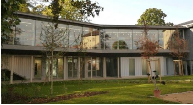
Centre Européen Robert Schuman

In der Garage des Hauses findet man ein Auto, das Schuman nie gefahren hat. Das Auto hatte für ihn keinen Nutzen.