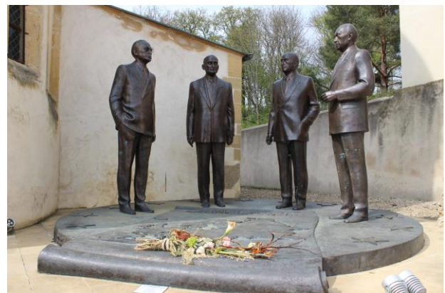
Scy-Chazelles : les Pères Fondateurs : Gasperi, Schuman, Monnet, Adenauer

Wir haben erfahren, dass Schuman eine Magd hatte, die ihm treu war. Sie lebte im Haus, während Schuman nach Paris jede Woche für sein Amt fuhr. Das Haus war nie leer, nur während des Krieges wurde es von deutschen Soldaten benutzt. Bei dieser Gelegenheit hatten diese Soldaten ein Heizungssystem installiert und haben es hinterlassen.